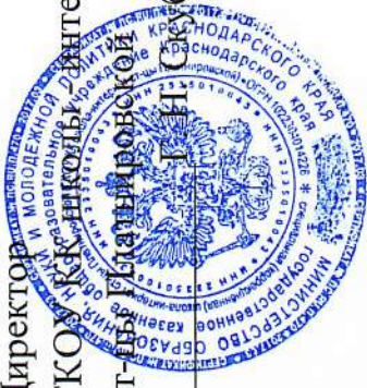
График работы операторов котельной ГКОУ КК школы - интерната ст-цы Платнировской